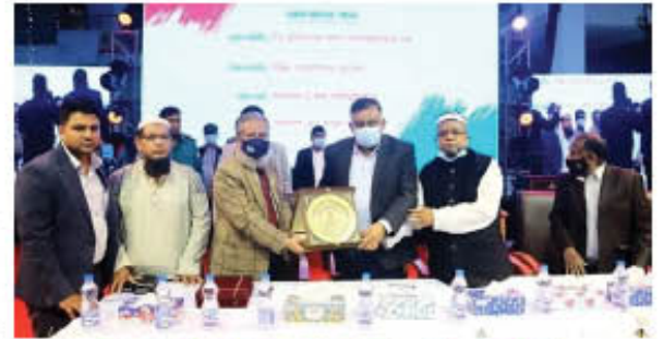
কলকাতা নবকমল বিশ্ববিদ্যালয় থেকে অর্জিত স্মরণীয় পদক প্রদান করা হচ্ছে বুটেক্সের প্রধান অতিথিদের।

তার জোরালো বক্তব্য তিনি উল্লেখ করেন কিভাবে বুটেক্স এই দেশকে সেরা প্রকৌশলী ও শিল্পপতি দিয়ে বাংলাদেশের অর্থনীতির প্রবৃদ্ধিতে অবদান রেখেছে। তিনি আরও উল্লেখ করেছেন যে কীভাবে শেখ মুজিবুর রহমান সর্বদা যে দিনটি বুনন ও বস্ত্র শিল্প এই দেশটিকে তার "নিম আয়ের" গভীরতা থেকে তুলে